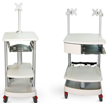
Carrello con alloggiamento per una bombola (sinistra) e per tre bombole (destra)